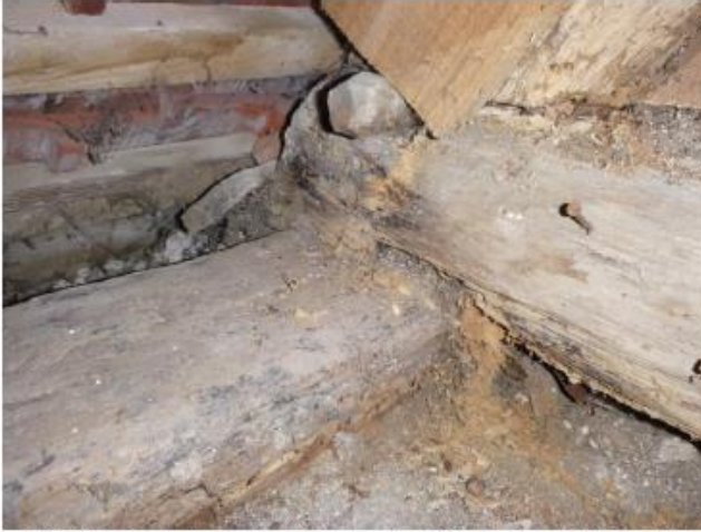
Bild 16 Deckenbalken und Außenschwelle Würfelbruch und Fäulnis DB 5/6

Bei einer Bauschau im Jahr 2015 wurde festgestellt, dass die in den 1980er Jahren durchgeführten Sicherungsmaßnahmen an unserem Kirchendachstuhl leider nicht ausreichend waren und weitere Schäden aufgetreten sind.