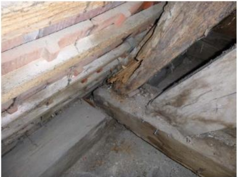
Bild 52 Sparren/Deckenbalken 13 Bund 4 Südseite

Damit sich alle Interessierten selbst ein Bild vor Situation machen können, besteht am 24. Juni beim Ettlenschießer Dorffest die Möglichkeit, der Kirche „auf's Dach“ (bzw. die Kirchenbühne) zu steigen und sich vor Ort die erforderlichen Sanierungsmaßnahmen von sachverständiger Seite erläutern zu lassen.