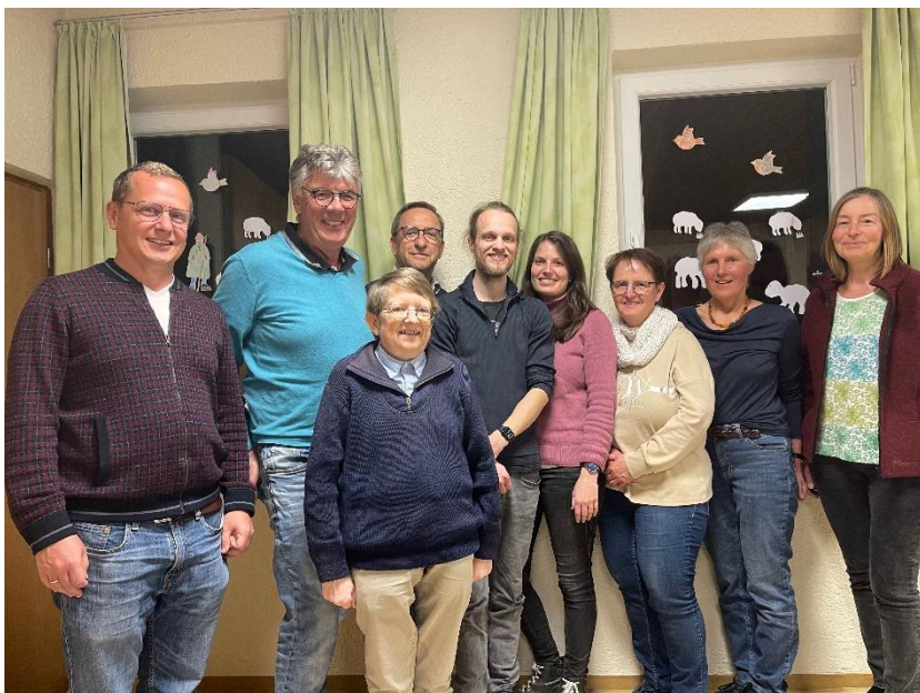
Bild: erste Steuerungsgruppensitzung in der Molke in Reutti am 16. April 2024