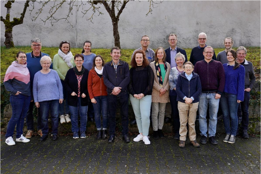
Bild: KGR-Vollversammlung am 23. März 2024 in Ballendorf

Gotthold Ephraim Lessing (1729 - 1781) deutscher Schriftsteller, Kritiker und Philosoph